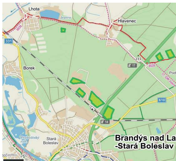
Mapa známých ploch s výskytem borovic poškozených smolařením v blízkosti Lhoty (podkladová mapa portálu www.mapy.cz ).