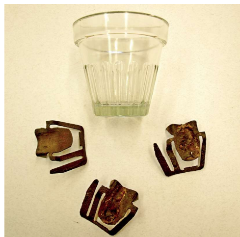
Předměty užívané k těžbě pryskyřice v 70. letech 20. století nalezené v okolí Staré Boleslavi (OMPv, historická sbírka, inv. č. HIS 6943).

Zdejší dosud identifikované lokality s výskytem „smolných“ borovic jsou znázorněny v přiložené mapce.