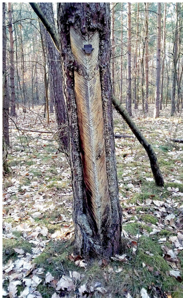
Jedna z borovic využitých ke smolaření jihovýchodně od Jezera, 2022.

Na stromech u Lhoty můžeme stále ještě najít již zmíněné svodné plíšky na pryskyřici. Původně byly na nich připevněny drátky a „látka“. Dle nálezu ze soboty 5. března 2022, který byl učiněn Milanem Tlustým pomocí detektoru kovů, se v tomto konkrétním případě jednalo o kůži, nebo materiál na bázi azbestu. Drátky s „látkou“ držely keramický kalíšek pro sběr pryskyřice. Kalíšky se do dnešních dnů nedochovaly, ale drátky a svodné plíšky s „látkou“ je možné v okolí stromů s pomocí detektoru najít stále. Navíc je u stromů dodnes možné spatřit polorozpadlý kovový soudek, který sloužil ke sběru pryskyřice z kalíšků (o rozměrech 44,5 x 23 cm).